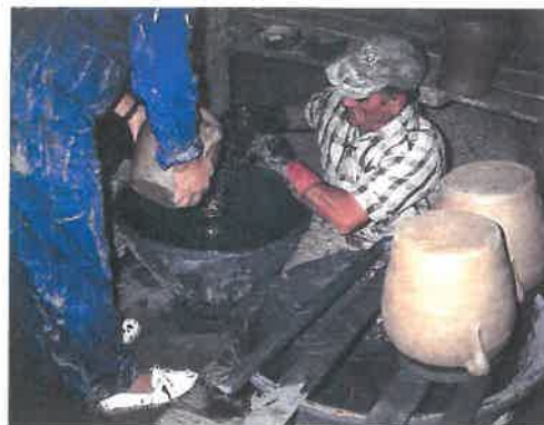
2 Pose de la glaçure plombifère à l'intérieur des pots par arrosage, vidage du surplus, égouttage. Atelier d'Agost, Alicante, Espagne

Lorsqu'une glaçure transparente ou opaque doit être teintée dans la masse, le colorant, très soigneusement broyé, peut être ajouté à la suspension aqueuse, mais il peut aussi être mélangé aux oxydes de plomb et d'étain dans la fritte.