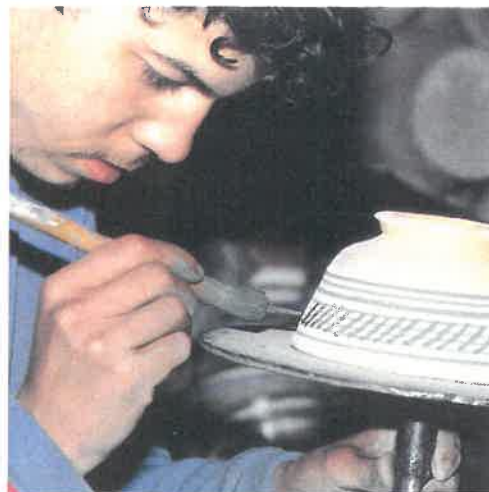
3 Peinture sur biscuit de bols au décor sous glaçure. Atelier de Fès, Maroc