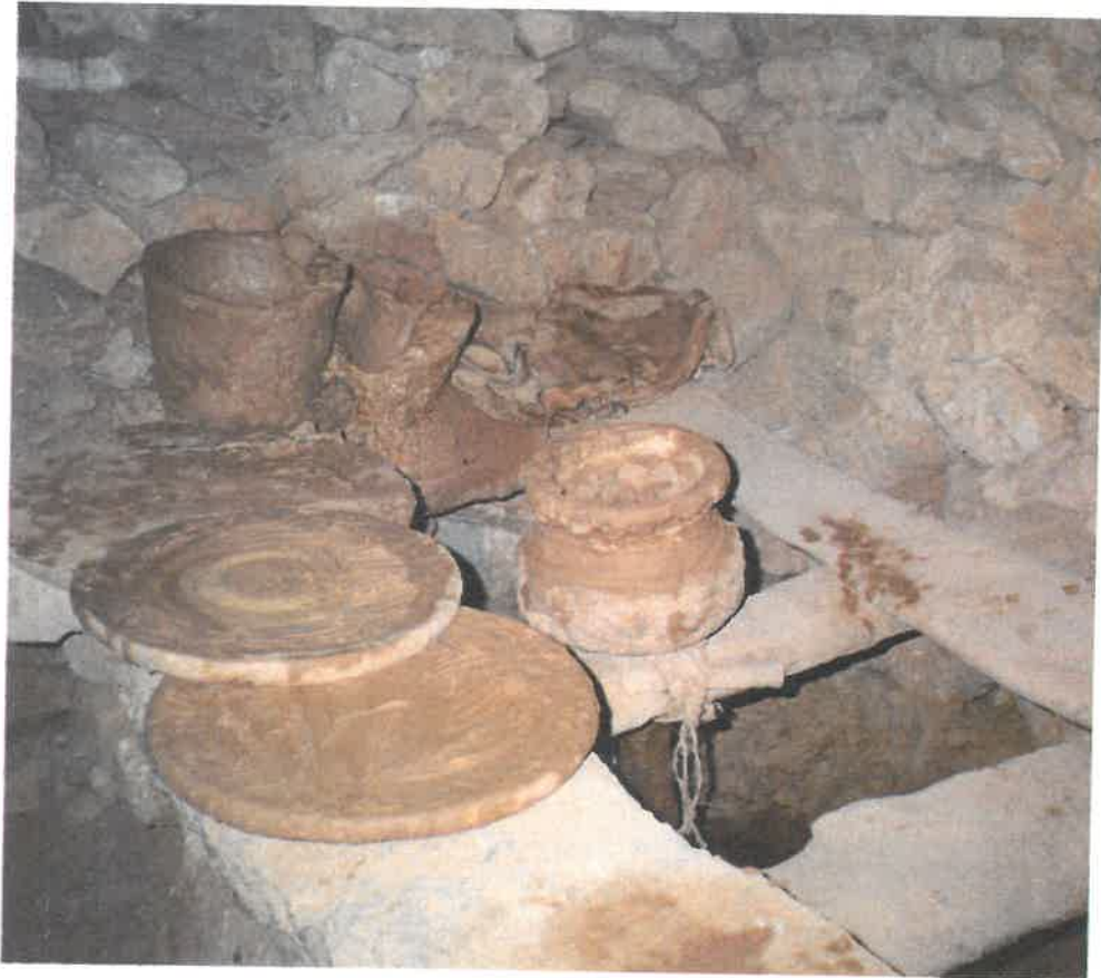
Atelier de potier Guellala, Jerba (Tunisie) Époque contemporaine