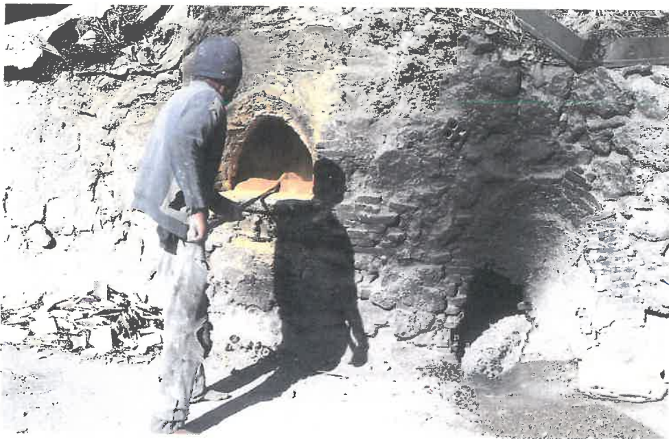
1 Fournette destinée au grillage du plomb et à sa transformation en oxyde (de couleur jaune). Atelier de Fès, Maroc

Les glaçures plombifères et alcalines ont la composition de verres au plomb et de verres sodiques, et, d'ailleurs, les premières phases de la préparation des glaçures et des verres présentent de fortes analogies.